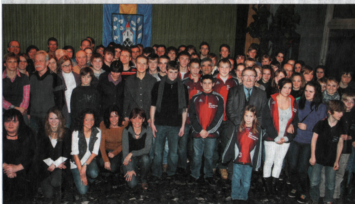
Mehr Super-Sportler als je zuvor, immerhin findet die Veranstaltung bereits seit 15 Jahren statt, ehrte die Stadt Waldkirch- nämlich 90.